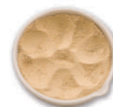
Ajo en polvo