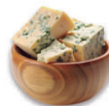
Queso azul Danés