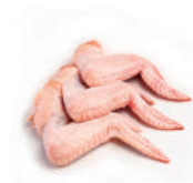
Alitas de pollo