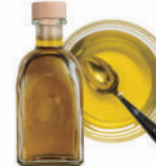
Aceite de oliva