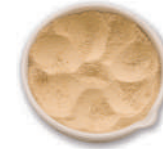
Ajo en polvo