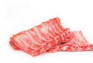
Costilla de cerdo