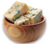
Queso azul Danés