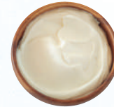
Crema de queso