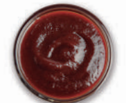
Salsa BBK casera