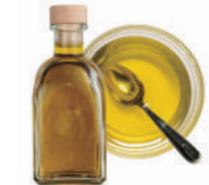
Aceite de oliva